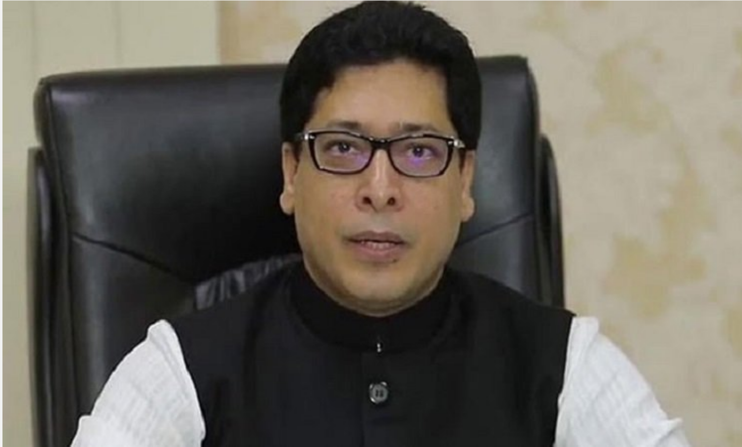
জনপ্রশাসন প্রতিমন্ত্রী ফরহাদ হোসেন। ফাইল ছবি

জনপ্রশাসন প্রতিমন্ত্রী ফরহাদ হোসেন বলেছেন, উন্নত বিশ্বের সাথে প্রতিযোগিতায় টিকে থাকতে হলে তথ্য প্রযুক্তির উপর আরও গুরুত্ব প্রদান করতে হবে।